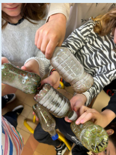
La bouteille de retour au calme