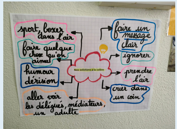
Mes solutions pour apaiser ma colère